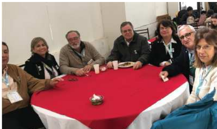
Figura 1. Reunión en el XXVII Congreso Brasileño y X Congreso Latinoamericano de Entomología, Gramado, Brasil, 2018.