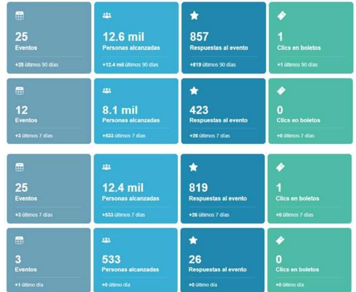
Figura 1. Eventos programados (25) en la página Fb de la SME del 15 de junio al 18 de agosto del 2020.

Los invitados especiales en el cierre del evento, celebrado el 19 de agosto, fueron el Director General de Sanidad Vegetal y el Presidente del CONACOFI. Al inicio se dio un resumen de las 29 charlas virtuales, donde se comentó que durante las 10 semanas se tuvo la participación de 30 ponentes (21 hombres y 9 mujeres, adscritos a 18 instituciones, de las cuales se tuvieron 22 charlas y 07 conferencias magistrales, con temas referentes a Acari, Arachnida, Scorpiones, Coleoptera, Hemiptera, Odonata, Hymenoptera, Orthoptera y sobre biodiversidad, bioindicadores, control biológico, distribución, entomotoxicología, plagas y taxonomía.